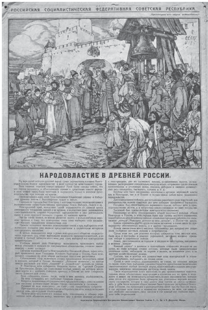
Рис. 5. Народовластие в Древней России

правления РСФСР. 1919 г. (Инв. №12/1920) («Желтый» в смысле золотой, а не желтая раса).