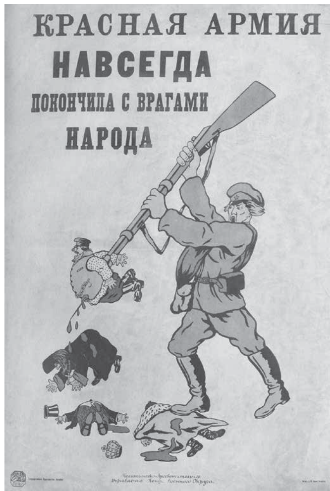
Рис. 4. Красная Армия навсегда покончила с врагами народа.

Ранний советский плакат, изменяя общую направленность, продолжает традиции плаката Первой мировой войны в формировании образа врага, меняя сам образ. Это и карикатуры: «Колчаковская надстройка. Товарищ, бей по фундаменту». Художник Авель. 1919 г. (фундамент – кулак). Инв. № 12/1835; антиклерикальные – «Товарищи мусульмане! Под зеленым знаменем Пророка шли вы завоевывать ваши