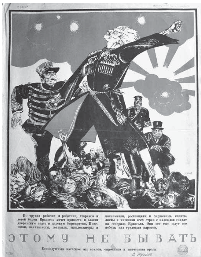
Рис. 2. Этому не бывать!

Одними из активных авторов в плакатном жанре были художники: А. Апсит, Д.С. Моор, В.Н. Дени, М.М. Черемных и др. Авторами тек-