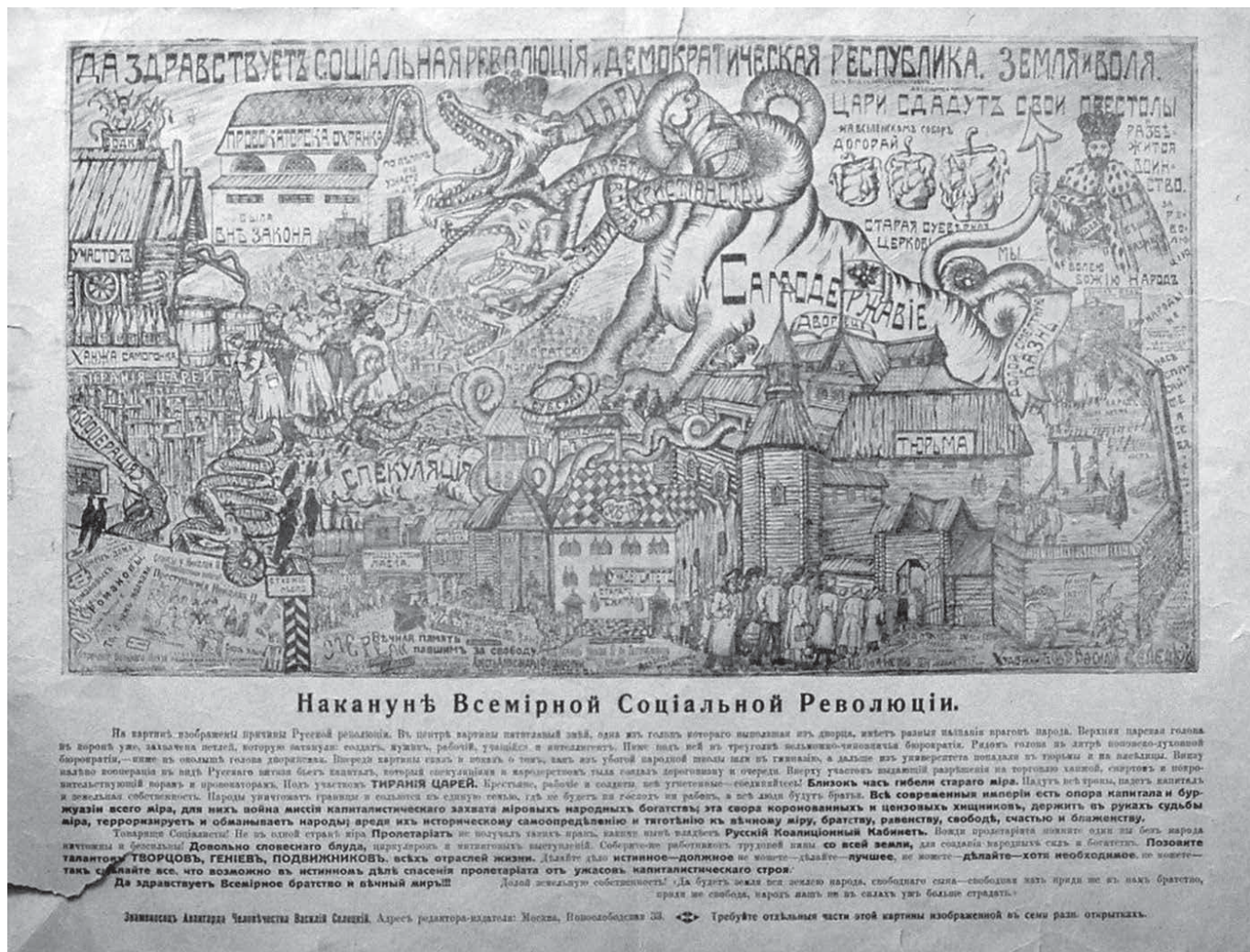
Рис. 3. Накануне Всемирной Социальной Революции

которые можно отнести к изучаемому периоду, можно добавить один из немногочисленных плакатов 1917 г. (в музее к этому году есть только два плаката) – «Накануне Всемирной Социальной революции». Художник Вас. Селецкий. Издательство Москва. 1917 г. Инв. № 12/2398. Рис 3.