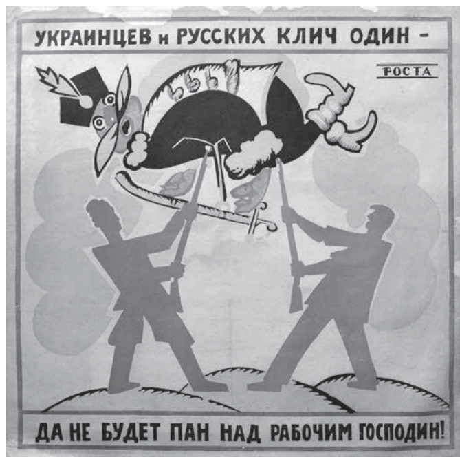
Рис. 1. Украинцев и русских клич один – да не будет пан над рабочим господин.

графики (в первую очередь Революции 1905–1907 гг.), а также русского народного лубка.